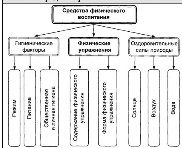
Рис. 1. Средства физического воспитания

Методы воспитания физических качеств. Методы строгой регламентации, применяемые для воспитания физических качеств, представляют собой различные комбинации нагрузок и отдыха. Они направлены на достижение и закрепление адаптационных перестроек в организме. Методы этой группы можно разделить на методы со стандартными и нестандартными (переменными) нагрузками.