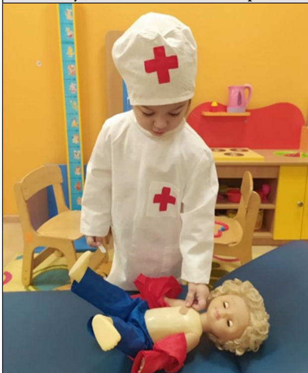
Рисунок 1. Наклеивает пластырь

Очень важно «запустить» игру, так как игра – это одно из важных средств познания окружающего мира. Это сложная, внутренне мотивированная, но в то же время легкая и радостная для ребенка деятельность. Творчество – это создание чего-то нового. Игра как вид деятельности ребёнка носит творческий характер. Сензитивным периодом для зарождения игры является именно ранний возраст. В этот период создаются условия для зарождения особого вида детской деятельности – процессуальной игры. В этом возрасте чётко прослеживается стремление ребёнка подражать действиям взрослых, которые он наблюдает в своей повседневной жизни. В основе процессуальной игры лежат предметные действия, которые ребенок осваивает в данный период. Для ребёнка привлекательно все, что делают взрослые, он хочет делать то же и так же, как они.