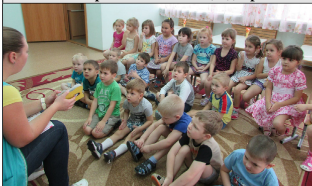
Рис. 1. Заучивание с дошкольниками стихотворений и пословиц о доброте

План реализации включает следующие этапы: