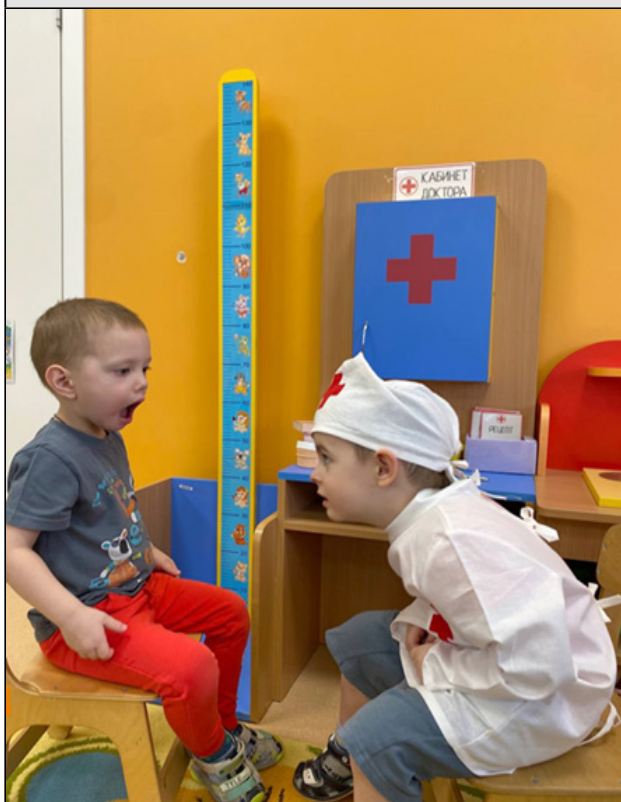
Рисунок 2. «Доктор» осматривает горло «больного»

В этом возрасте ребенок способен преодолеть навязываемый сюжетными игрушками ход игры и переструктурировать ситуацию, придумав собственный сюжет, построенный на одних лишь замещениях. Такая игра становится по-настоящему творческой.