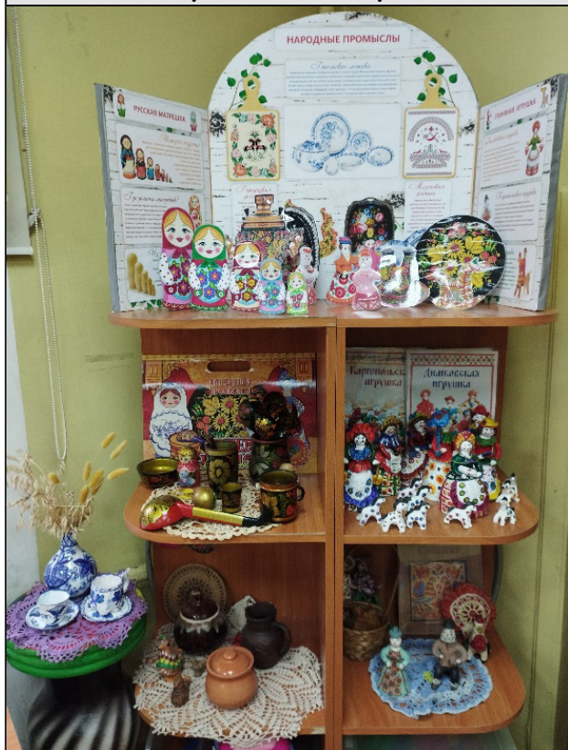
Рисунок 4. Мини-музей

Работу с музеем мы проводим следующим образом. В ходе занятий по образовательным областям «Познавательное развитие», «Художественно-эстетическое развитие» демонстрируем детям экспонаты и рассказываем об их истории, особенностях росписи. У детей есть возможность своими руками прикоснуться к предметам народного творчества, а это очень ценно и интересно. Некоторые экспонаты музея мы применяем в ходе театрализации (например, во время кукольного театра).