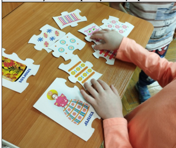
Рисунок 2. Игра «Русские узоры»

Чтобы показать детям все разнообразие предметов русского народного творчества, мы создали несколько лэпбуков. Так, это лэпбуки на темы «Дымковская игрушка», «Каргопольская игрушка». В данных дидактических пособиях представлены задания для детей: собрать разрезные картинки, определить узор и т.д. (рисунок 3)