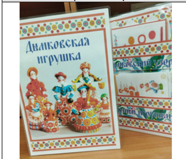
Рисунок 3. Лэпбук

Чтобы показать детям все разнообразие предметов русского народного творчества, мы создали несколько лэпбуков. Так, это лэпбуки на темы «Дымковская игрушка», «Каргопольская игрушка». В данных дидактических пособиях представлены задания для детей: собрать разрезные картинки, определить узор и т.д. (рисунок 3)