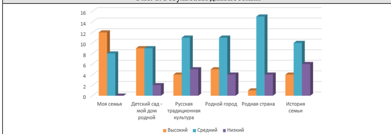
Рис. 1. Результаты диагностики

Результаты диагностики по блоку «Моя семья» показали, что у 12 человек из 20 преобладает высокий уровень знаний о своей семье и близких родственниках. Дошкольники без труда называют свою фамилию и имя, рассказывают о профессии своих родителей, устанавливают родственные связи, при помощи наводящих вопросов, аргументируют свой ответ, 8 человек имеют средний уровень знаний, дети допускали незначительные ошибки, помощь воспитателя требовалась в единичных случаях.