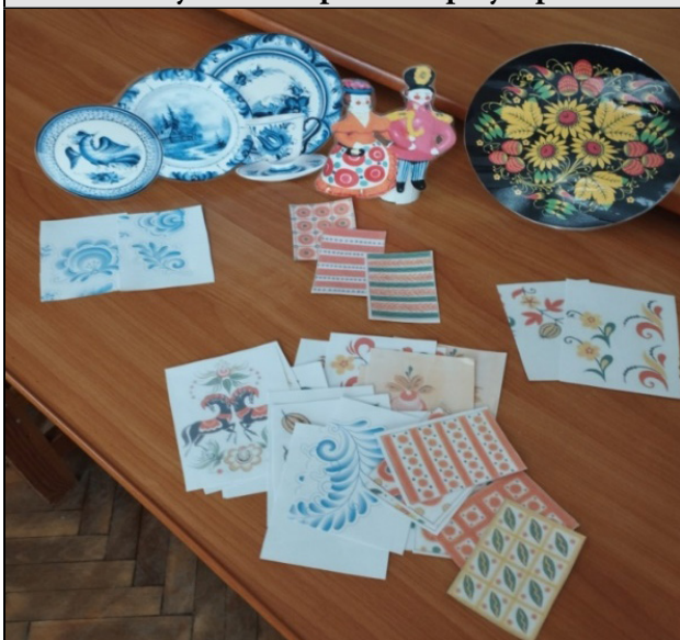
Рисунок 1. Игра «Собери узор»

Изготовили дидактические игры, с помощью которых дети лучше познакомились с народным творче-