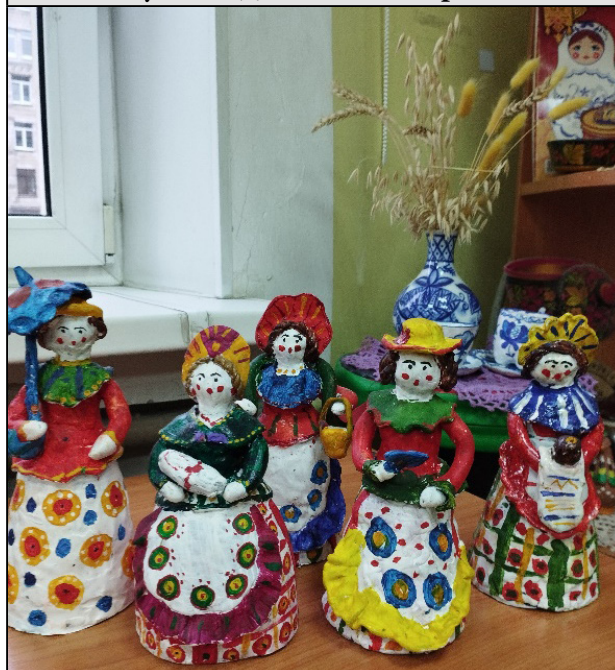
Рисунок 5. Дымковские барышни