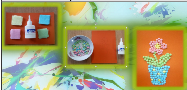
Рисунок 2. Комочки

Салфетки используются для создания картин и другими способами. В некоторых случаях они не сминаются в небольшие клубочки, а просто нарезаются на детали нужной формы или скручиваются в жгутики (Рис. 3 Жгутики) или вообще превращаются в пластичную однородную массу (Рис. 4 Однородная пластичная масса). Какой вариант лучше выбрать, каждый мастер решает сам для себя. Нередко это зависит от желаемого рисунка (Рис. 5 Объемные колечки).