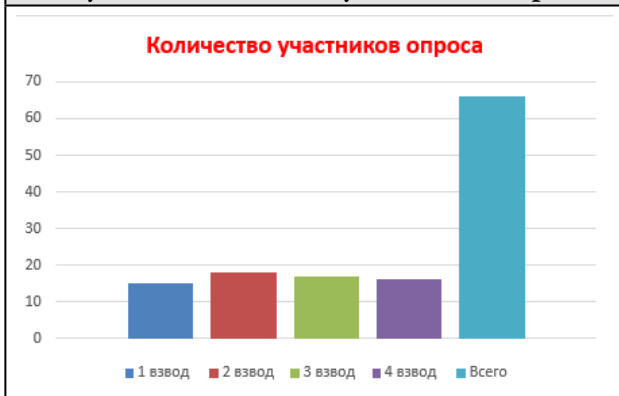
Рисунок 1. Количество участников опроса

На вопрос «Знаешь ли ты кто такой наставник?» 58 человек – 88% опрошенных знают кто такой наставник (рис. 2).