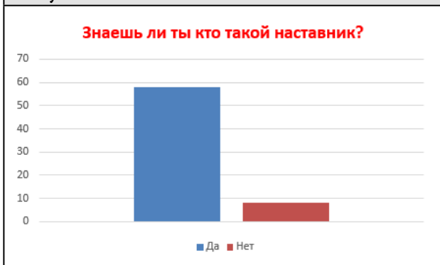
Рисунок 2. Знаешь ли ты кто такой наставник

На вопрос каждый ли человек сможет быть наставником, 73% ответили, нет, 27% ответили да (рис. 3).