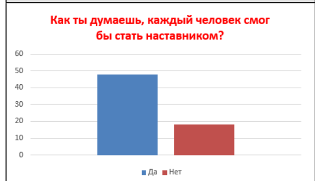
Рисунок 3. Как ты думаешь, каждый человек смог бы стать наставником

Радует, что многие суворовцы писали, что их наставники – это воспитатели роты и даже некоторые товарищи по взводу и роте. Так родилась идея применения второй формы наставничества в нашей роте «ученик-ученик».