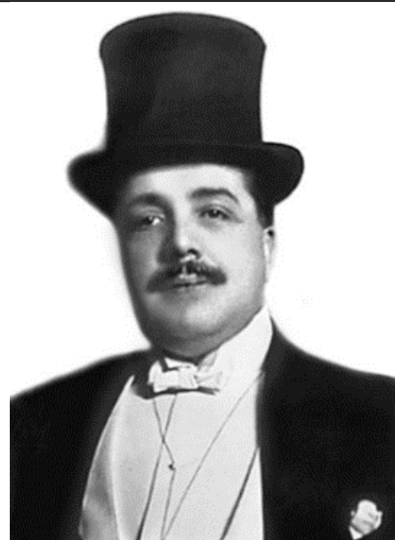
Сергей Павлович Дягилев